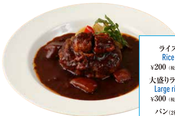
ビーフシチューハンバーグ ¥2,500 Hamburg steak with beef stew (税込¥2,750)

ライス Rice ¥200 (税込¥220) 大盛りライス Large rice ¥300 (税込¥330) パン(2種) 2 type of bread ¥300 (税込¥330)