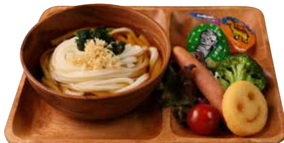
キッズうどんセット ¥900 Kids noodle "udon" plate (税込¥990)