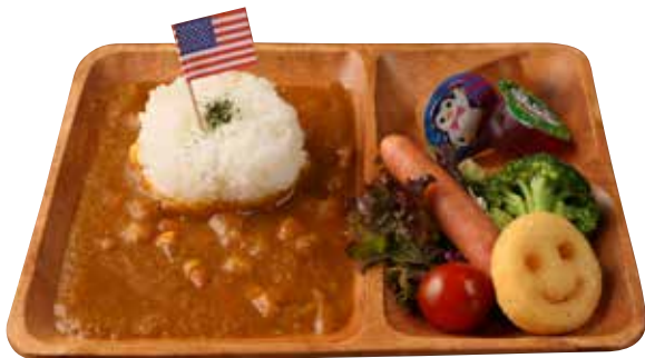
※キッズハンバーグをのせてご提供いたします。 キッズハンバーグカレープレート ¥1,000 Kids hamburg steak & mild curry plate (税込¥1,100)

調理の工程上、共通の設備で 製造・調理しているため、 表示されている材料以外の アレルギーが混入(コンタミネーション) する場合がございます。