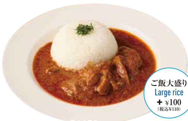
スパイシーマレーシアカレー (スパイスが効いた辛口カレー) Spicy chicken curry (malaysian style)

ライス Rice ¥200 (税込¥220) 大盛りライス Large rice ¥300 (税込¥330) パン(2種) 2 type of bread ¥300 (税込¥330)