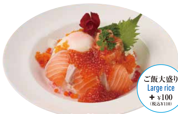
炙り漬けサーモンといくらのたまごご飯 ¥2,000 Rice bowl topped with soy marinated seared salmon & salmon roe with poached egg (税込¥2,200)