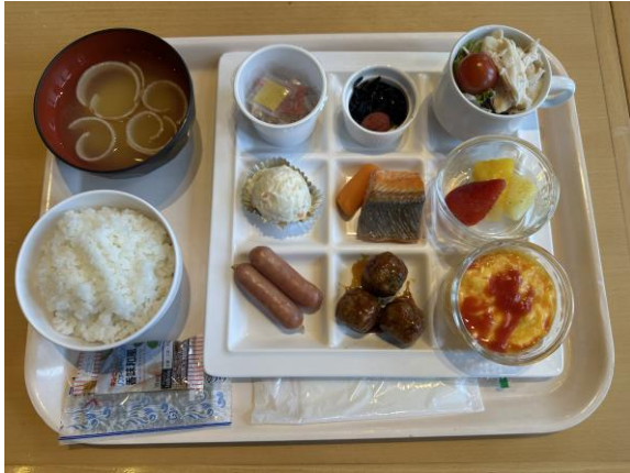
朝食セットメニューイメージ

サラダ（レタスミックス・プチトマト）・ポテトサラダ・ベビーキャロット・蒸し鶏・ソーセージ・肉団子 スクランブルエッグ・焼き鮭・納豆・味付け海苔・梅干し・ごま昆布・フローズンフルーツ・白米・味噌汁 ポーションドレッシング