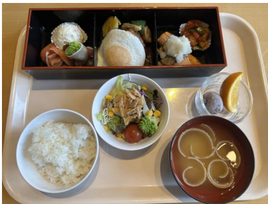
夕食セットメニューイメージ

サラダ（レタスミックス・プチトマト・ブロッコリー・コーンツナ）・ポテトサラダ・スモークサーモン・ 生ハムロマネスコ・カポナータ・目玉焼きビーフシチューハンバーグ・サーモンの塩焼き～おろしポン酢・ 焼き野菜・オレンジ・ライチ・白米・味噌汁