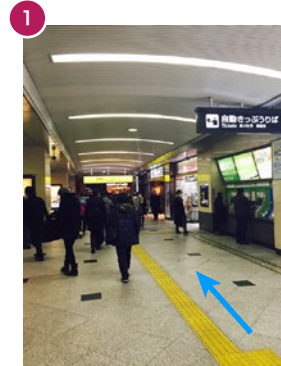
JR 大阪駅 桜橋口改札を右に出ます。 Go out the Sakurabashiguchi Exit, to the right.