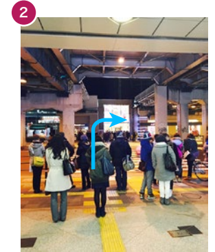
そのまま直進すると横断歩道があります。 横断歩道を渡ってから右方向へ。 Go straight, then across the street.