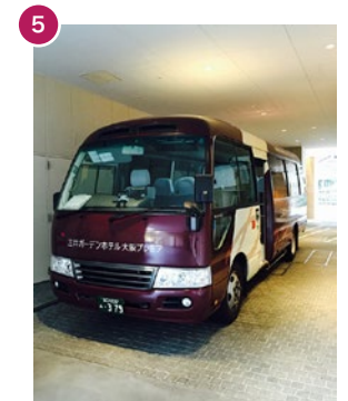
シャトルバスが到着します。 (車輛点検等で車種が変更することもあります) Shuttle bus will arrive. (*The bus might be change.)