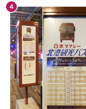
その歩道の上に、時刻表看板があります。 Please wait a shuttle bus near the signboard.