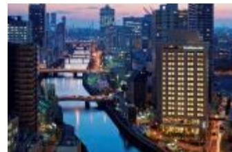
大阪プレミア:外観