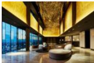
名古屋プレミア:ロビー