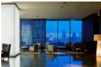
銀座プレミア:ロビー

三井不動産ホテルマネジメントグループは、三井ガーデンホテルズを全国に20ホテル(5,337室)運営しております。2017年には新ブランド「ザ セレスティンホテルズ」を展開し、9月には「ホテル ザ セレスティン祇園」、10月には「ホテル ザ セレスティン銀座」を開業いたします。また、2018年には東京の日本橋・東五反田・大手町に開業し、グループ運営客室数が6,400室超となる予定です。「記憶に残るホテル」「感性豊かなお客様の五感を満たすホテル」という理念・ホテルコンセプトのもと、デザイン性の高さと機能性を備えた滞在空間に、ホスピタリティ溢れるサービスを提供しています。