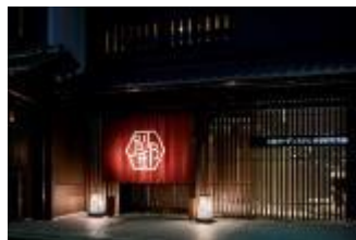
京都新町 別邸:エントランス