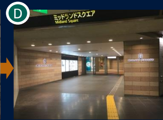
ミッドランドスクエアに進みます