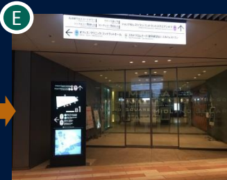
ショップ&レストラン入口からミッドランドスクエアに入ります