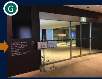
ミッドランドスクエアを出てシンフォニー豊田ビル方面へ進みます