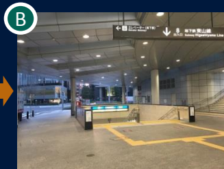
右手の交番手前の階段を下り、地下に入ります。 (8番出入口)