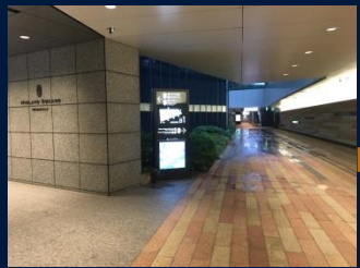
入口が複数ありますが、ショップ&レストラン入口まで進みます