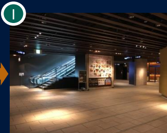
チカマチラウンジの広場を右に曲がります