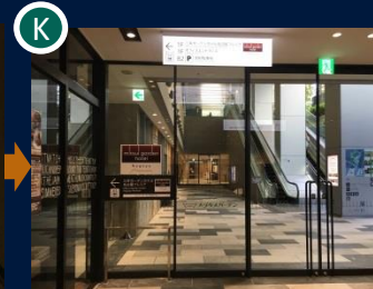
左側にホテル看板がある扉で左に曲がります