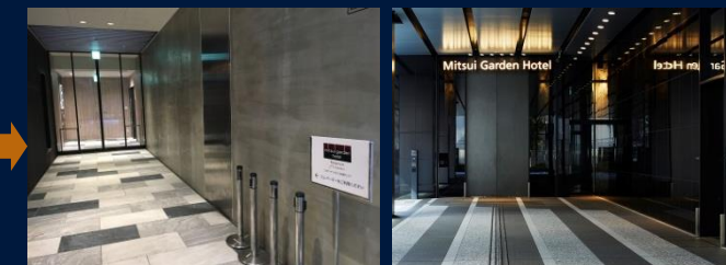
エレベーターで1階に上がり、右手のホテル入口からエレベーターをお乗換えください