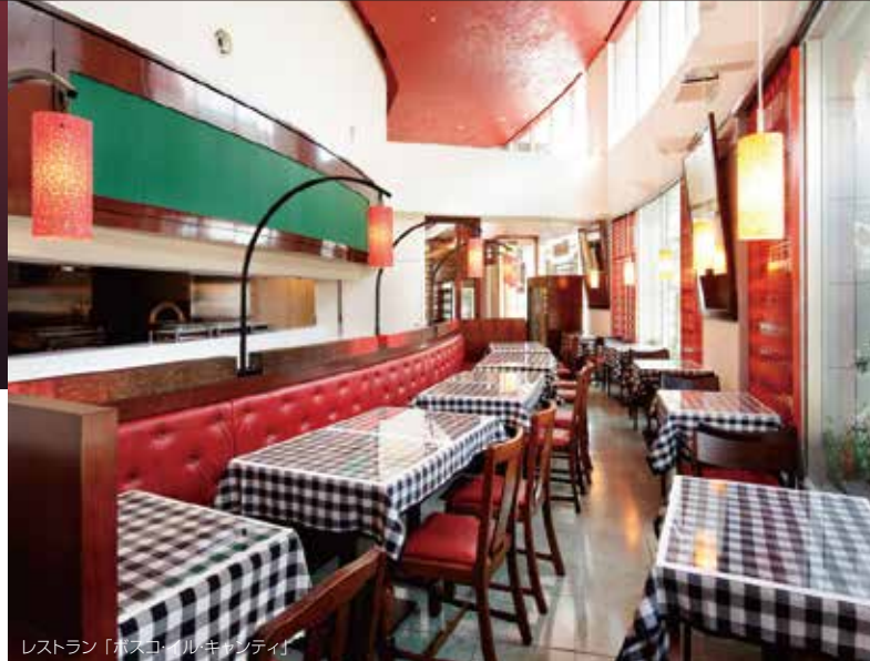
レストラン「ビストロ・ルキシティ」

〒110-0015 東京都台東区東上野3-19-7 TEL:03-3839-1131 FAX: 03-3839-1605 http://www.gardenhotels.co.jp/ueno/