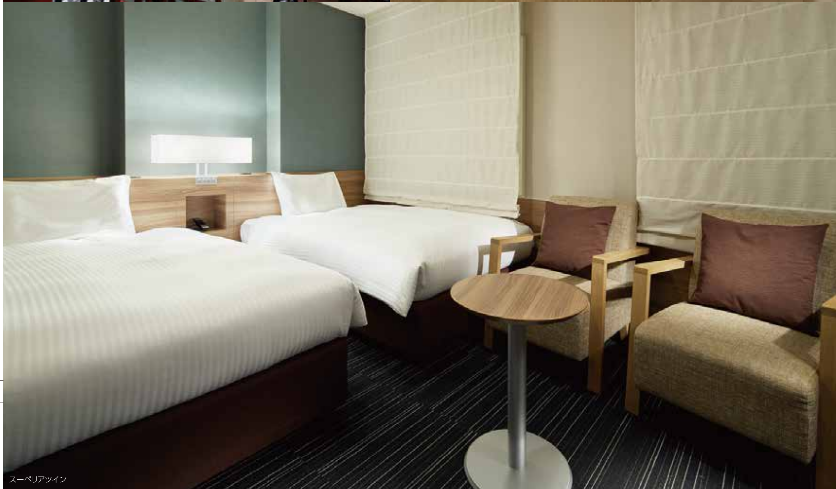
スーベリアツイン