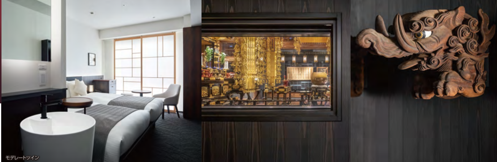
モテレートツイン

https://www.gardenhotels.co.jp/ kyoto-kawaramachi-jokyoji/