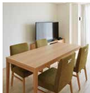
ファミリー (リビング)

19.8㎡の広さを確保したシングルは快適性と機能性を重視。ベッドはセミダブルサイズでゆったりとお休みいただけます。