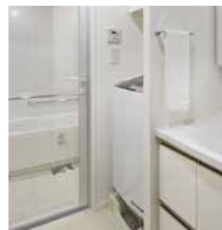
スタジオダブルE (バス周り)